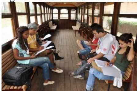
Figura 3 – Jovens realizando a Conferência da Juventude de Araras – 2015

Alguns exemplos de Conferência da Juventude podem ser tirados de eventos da própria administração ararense, que realizou o evento nos anos de 2015 e 2016, sendo em 2015 que o tema do encontro foi “A mudança no Brasil começa por nós”, onde os membros do Conselho da Juventude elegeram delegados para participar da Conferência Regional da Juventude. Atualmente, além da regional, existem ainda a Conferência Estadual e Nacional da Juventude, com calendários previamente divulgados por suas respectivas esferas governamentais.