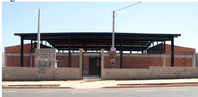
Figura 2 – Casa da Juventude recém construída em Araras

O investimento na cidade é de R$ 1.228.217,08. Além de cursos, a Casa da Juventude incentivará o coworking com uma área projetada especificamente para o trabalho colaborativo, garantindo que os jovens possam desenvolver projetos empresariais em diversos setores. As Casas da Juventude também serão unidades acadêmicas e operacionais para atividades presenciais de cursos oferecidos pela Univesp (Universidade Virtual do Estado de São Paulo).